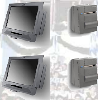
IBM ANYPLACE mit Bondrucker (Wandmontage möglich)

Mit Schlüssel- oder Fingerabdruckleser, Kundendisplay, Kassenschublade, Bondrucker, Magnetkartenleser (EC-/Kreditkartenabwicklung).