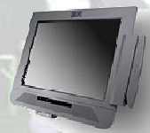
Küchenmonitor IBM ANYPLACE