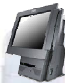
IBM SurePOS 500